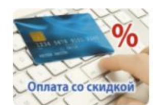
Оплата со скидкой